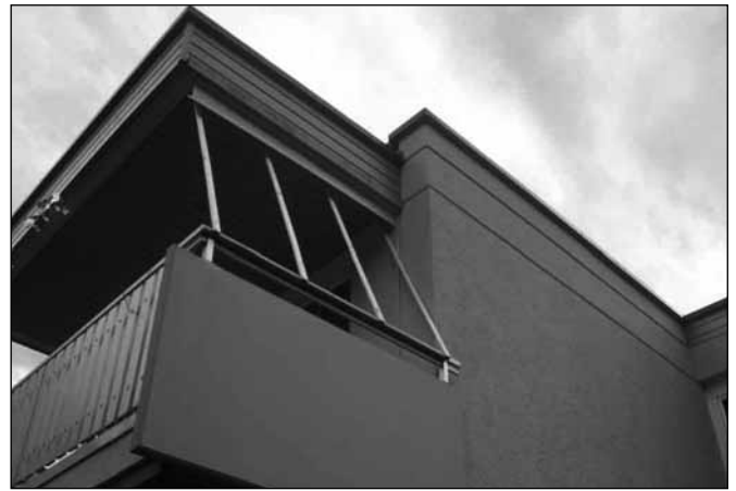
Ein Rollo löst ein „Fledermausproblem“

Am 1. November 2005 wurden weitere Kästen gemeinsam mit Harald Mixanig im Bereich des weitläufigen Parks zwischen Stadttheater, Napoleonstadel und Landesgericht Klagenfurt aufgehängt.