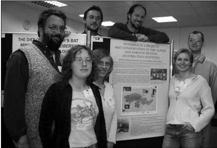
Gemeinsames Arbeiten für den Fledermausschutz im Alpen- und Adriaraum