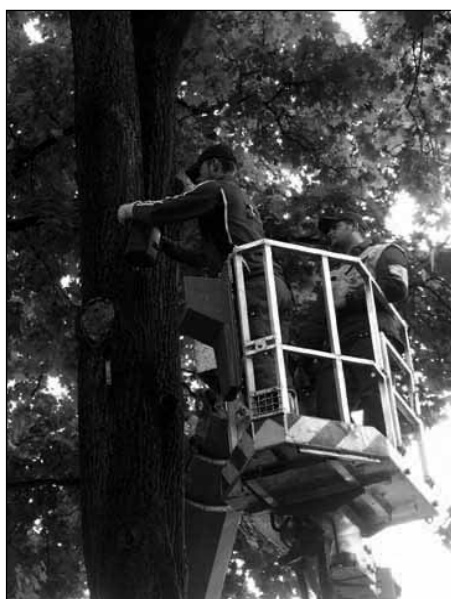
Montage der Fledermauskästen im Hülgerthpark

Auf Initiative der Arge NATURSCHUTZ wurden mit Unterstützung der Abteilung Stadtgarten und gemeinsam mit der Umweltschutzreferentin und Stadträtin Dr. Maria-Luise Mathiaschitz-Tschabuschnig am 7. Oktober 2005 im Hülgerthpark nahe der Altstadt Fledermauskästen montiert. Die Fledermauskästen wurden aus Sicherheitsgründen zwischen 6 und 9 m aufgehängt. Der Hülgerthpark wurde ausgewählt, weil aus einem der Bäume vor 2 Jahren aus einer Buntspechthöhle ausfliegende Fledermäuse beobachtet wurden, die am angrenzenden Messeparkplatz nach Insekten jagten.