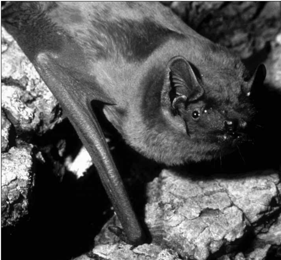
Der Große Abendsegler fällt im Herbst oft auf, wenn er bereits am Nachmittag auf Insektenjagd geht