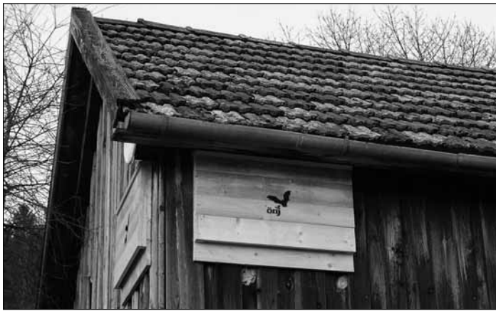
Die Kästen sind groß und lassen sich gut kontrollieren