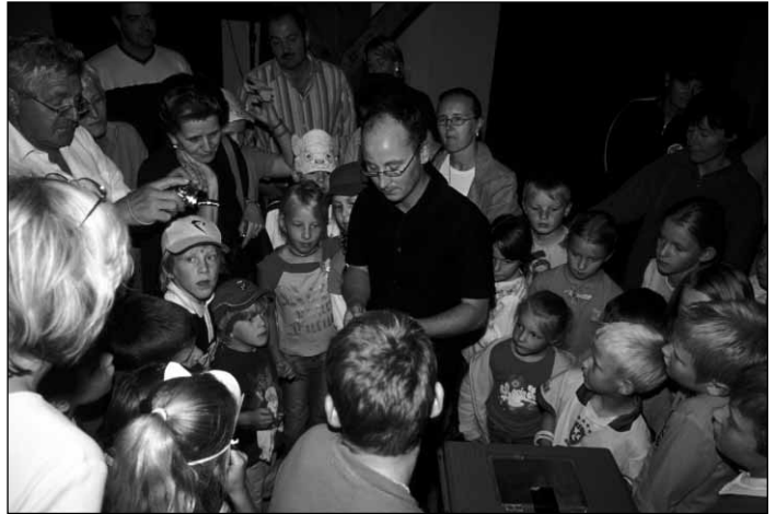
Die Fledermausnacht in Paternion war ein voller Erfolg