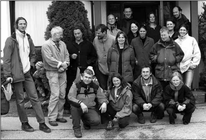
Gemeinsam ist es leichter, sich den neuen Herausforderungen zu stellen!