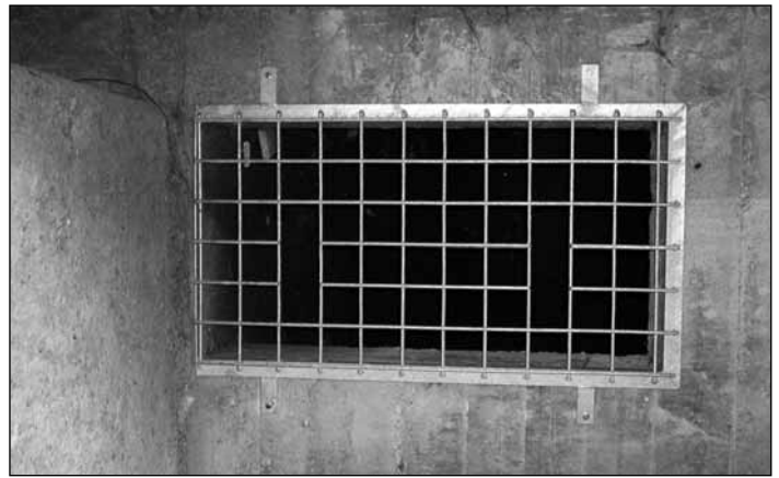
Vergitterung in der Lingenauer Hochbrücke

Rohrbach an Stadeln, Holzhöfen, Vieh- unterständen, Garagen etc. ein bis neun (durchschnittlich 3,6) Kästen montiert.