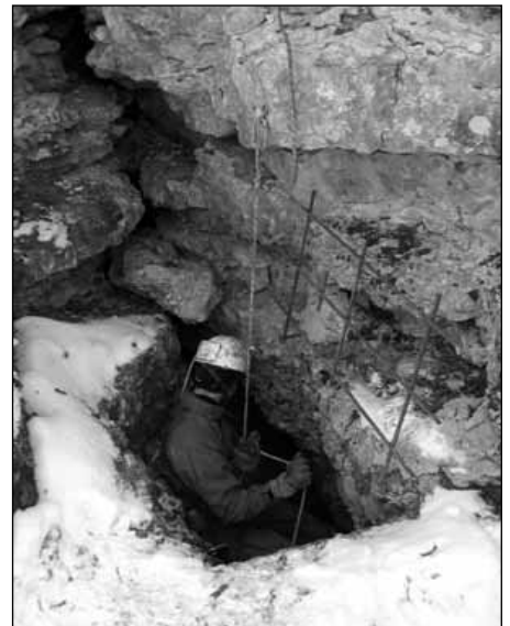
Winterquartierkontrolle in Slowenien

Zuerst wurden den Interessierten die wichtigsten Bestimmungsmerkmale vorgestellt, danach ging es ans Bestimmen. In Salzburg fand der Bestimmungskurs wieder im Vereins-