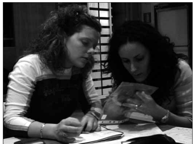
Grenzüberschreitende Bestimmungsarbeit in Südtirol

Im Rahmen eines Studenten-Forschungscamps in Lovrenc na Pohorju (Slowenien) wurde eine Fledermaus-Forschungs-Gruppe gegründet. Die Themen im Camp umfassten die Bestimmung von lebenden Fledermäusen und Präparaten (vor allem Skelette, Schädel), die Arbeit mit Mischer- und Zeitdehnungs-Ultraschalldetektoren inklusive der Auswertung der aufgezeichneten Fledermausrufe, Quartierkontrollen, Netzfänge. Zudem wurde auch Basiswissen über GIS, d.h. Geografische Informationssysteme, vermittelt.