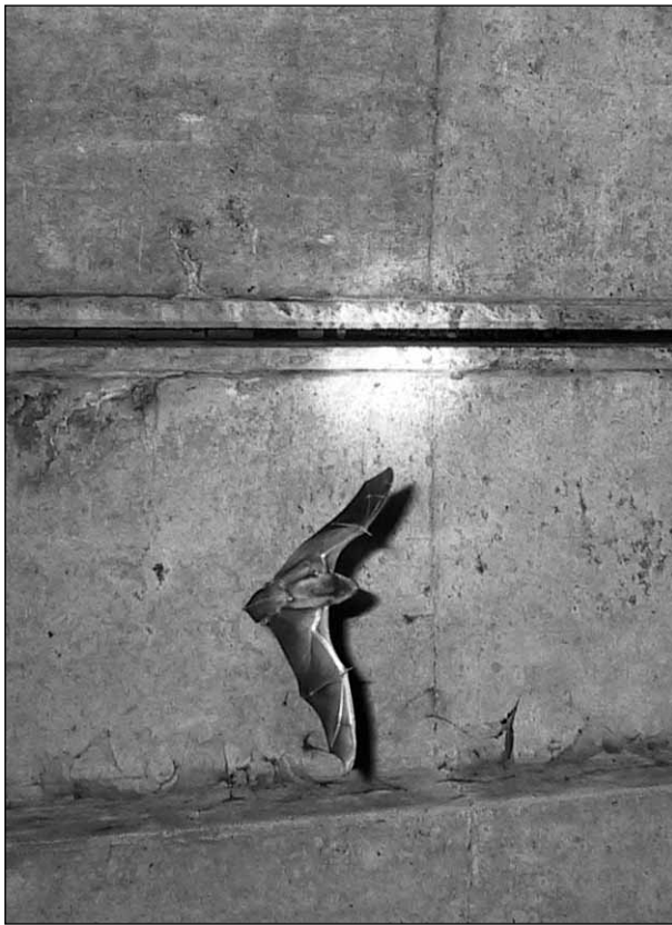
Quartier von Großen Abendseglern in der Dehnungsfuge einer Autobahnbrücke

Weibchen bei den Männchen. Die Balzrufe sind zum Teil so laut und niedrigfrequent, dass sie sogar für uns Menschen als lautes Zetern und Trillern hörbar sind. Achten Sie im Herbst einmal darauf, wenn Sie durch einen Wald mit Altholzbeständen oder auch alte Alleen gehen!