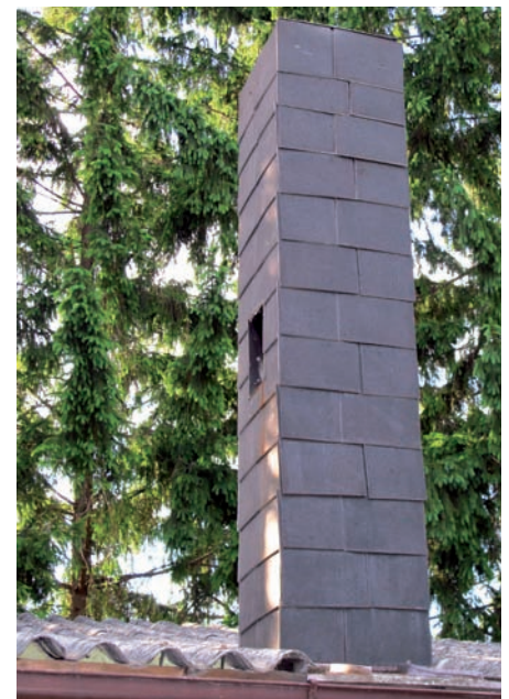
Um solche Quartiere zu finden, braucht es zumeist Tipps von Hausbesitzern.