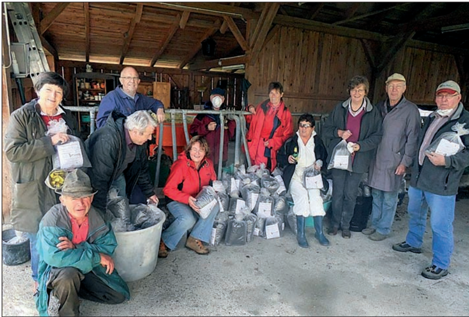
Die „Bergmandl“ haben kräftig Guano geerntet und eingesackt.