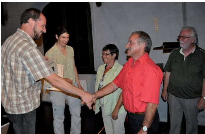
Nach dem Vortrag wurde bei der Batnight noch die Ehrung des Quartiergebers von über 280 Zwergfledermäusen vorgenommen. Als Abschluss des Abends begaben wir uns zur Ausflugsbeobachtung von über 1000 Mausohren ...

Durch die Quartiermeldungen wurden die Kleine Hufeisennase, das Mausohr, die Breitflügelfledermaus, die Zwergfledermaus, die Wasserfledermaus und die Wimperfledermaus für Micheldorf nachgewiesen. Unter anderem befinden sich auch Wochenstuben darunter (Kleine Hufeisennase, Mausohr, Zwergfledermaus). Es