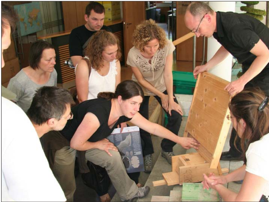
Verschiedenste Ersatzquartier-Modelle konnten beim Workshop näher inspiziert werden.