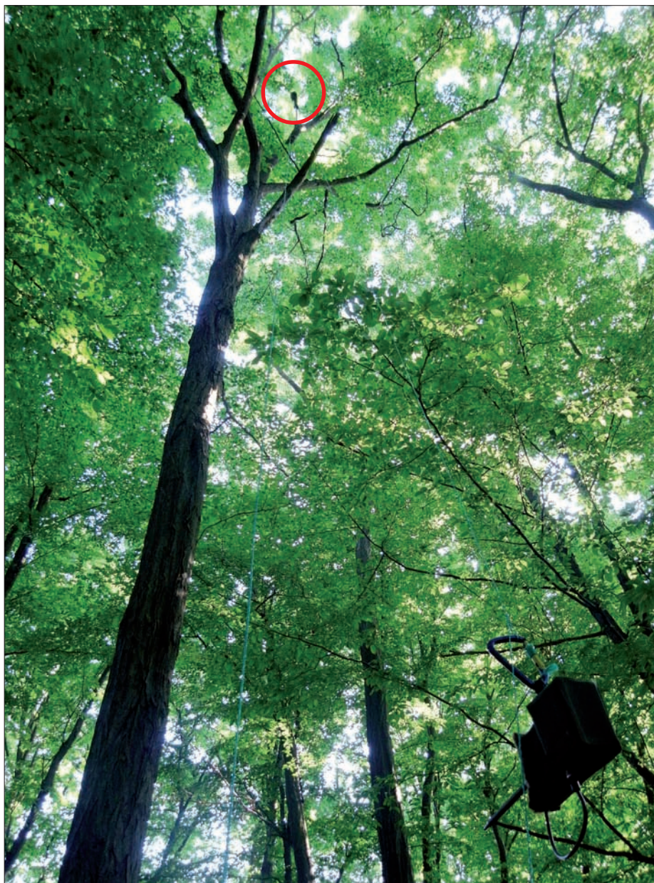
Die zwei Batcorder (unten rechts & oben im roten Kreis) zu montieren, ist mitunter eine knifflige Angelegenheit.

einziges Stratum nachgewiesen werden konnten. Aufgrund des erhöhten Aufwandes wird das Erheben in den Baumkronen nicht empfohlen, sondern es erscheint wichtiger, dass mit den vorhandenen Ressourcen möglichst viele Habitattypen abgedeckt werden. Sobald es aber für die Untersuchung wichtig ist, neben dem reinen Arteninventar auch deren Aktivität (als Näherung für die Häufigkeit) abzuschätzen, so ist bei Waldstandorten eine Erhebung des Baumkronenbereichs auf jeden Fall anzudenken. Abhängig von der Jahreszeit zeigen bis zu 50 % der Arten eine signifikant höhere Aktivität im Baumkronenbereich. Im Zuge eines Monitorings bestimmter Arten (welche eine Präferenz