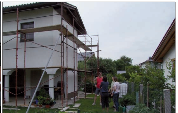
Dank Naturschutzbund Oberösterreich, der die beiden Kästen gespendet hat, konnten wir bei dieser Renovierung des Einfamilienhauses schnell handeln und den Fledermäusen für nächstes Jahr ein neues Zuhause anbieten.