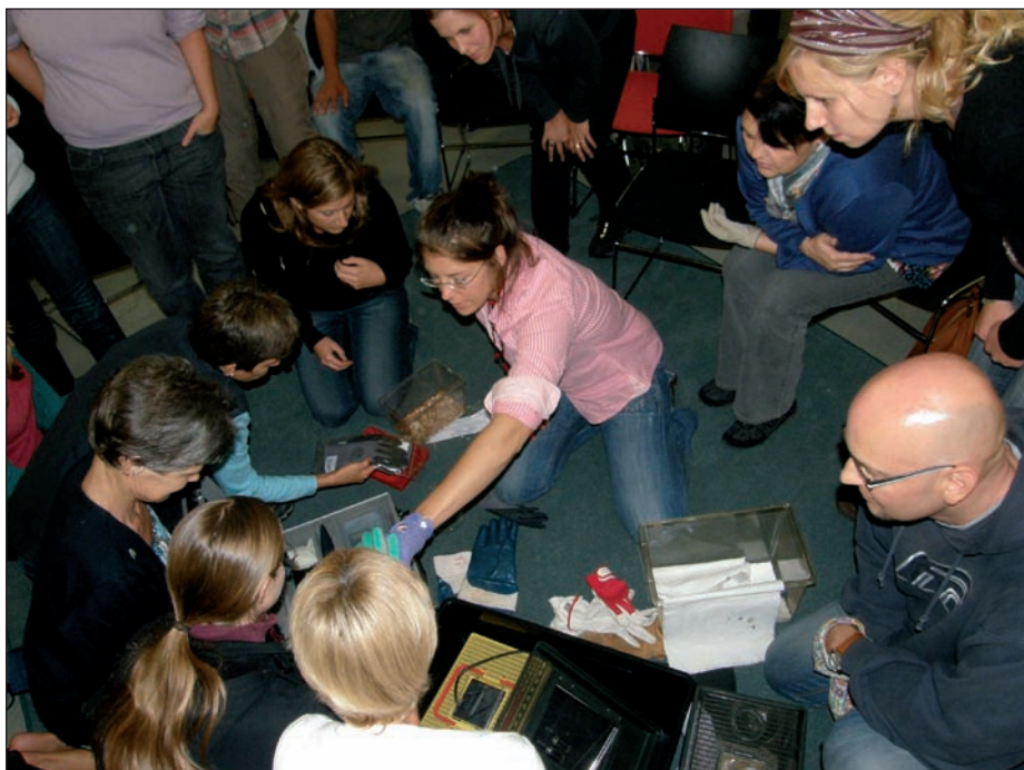
Neben Theorie gab es praxisnahe Fledermauspflge, aber auch „Mehlwurmpflge“ beim Fledermaus-Pflege-Workshop im Haus der Natur in Salzburg.