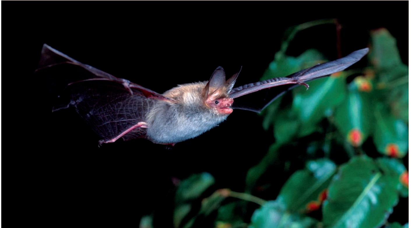
Die Bechsteinfledermaus nutzt zur Jagd gerne das Kronendach