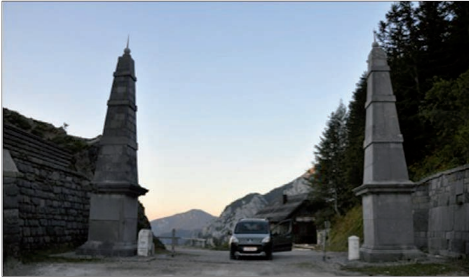
Der Grenzübergang Alter Loiblpass – Blick in Zugrichtung N-S auf die Slowenische Seite. Der Pass bildet eine Engstelle, die im Osten und im Westen von Bergrücken begrenzt wird.